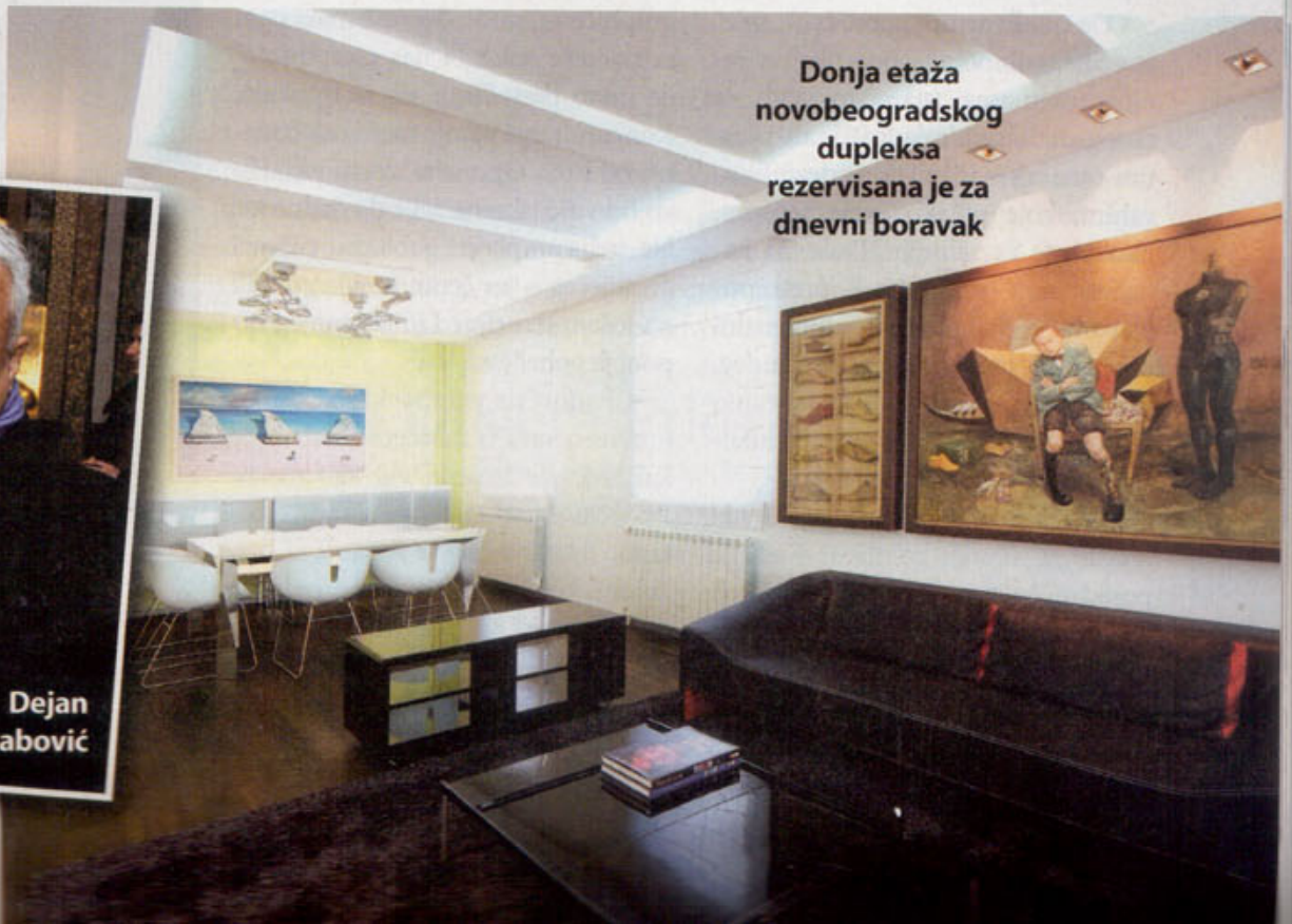
Donja etaža novobeogradskog duplexa rezervisana je za dnevni boravak

vremena oseća se i u nameštaju najmodernijeg dizajna.