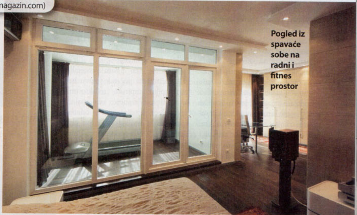
Pogled iz spavaće sobe na radni i fitness prostor