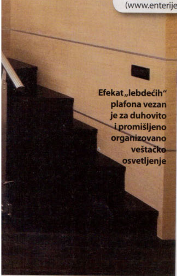
Efekat „lebdećih“ plafona vezan je za duhovito i promišljeno organizovano veštačko osvetljenje

Materijal je preuzet iz časopisa za lepši život „Enterijer“ ( www.enterijermagazin.com )