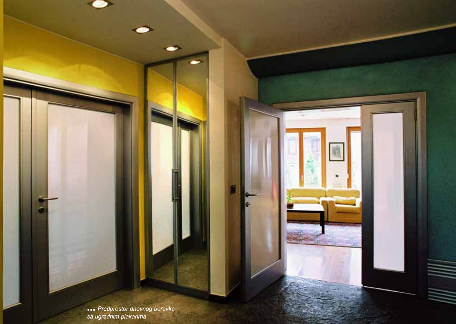
... Predprostor dnevnog boravka sa ugradnim plakarima