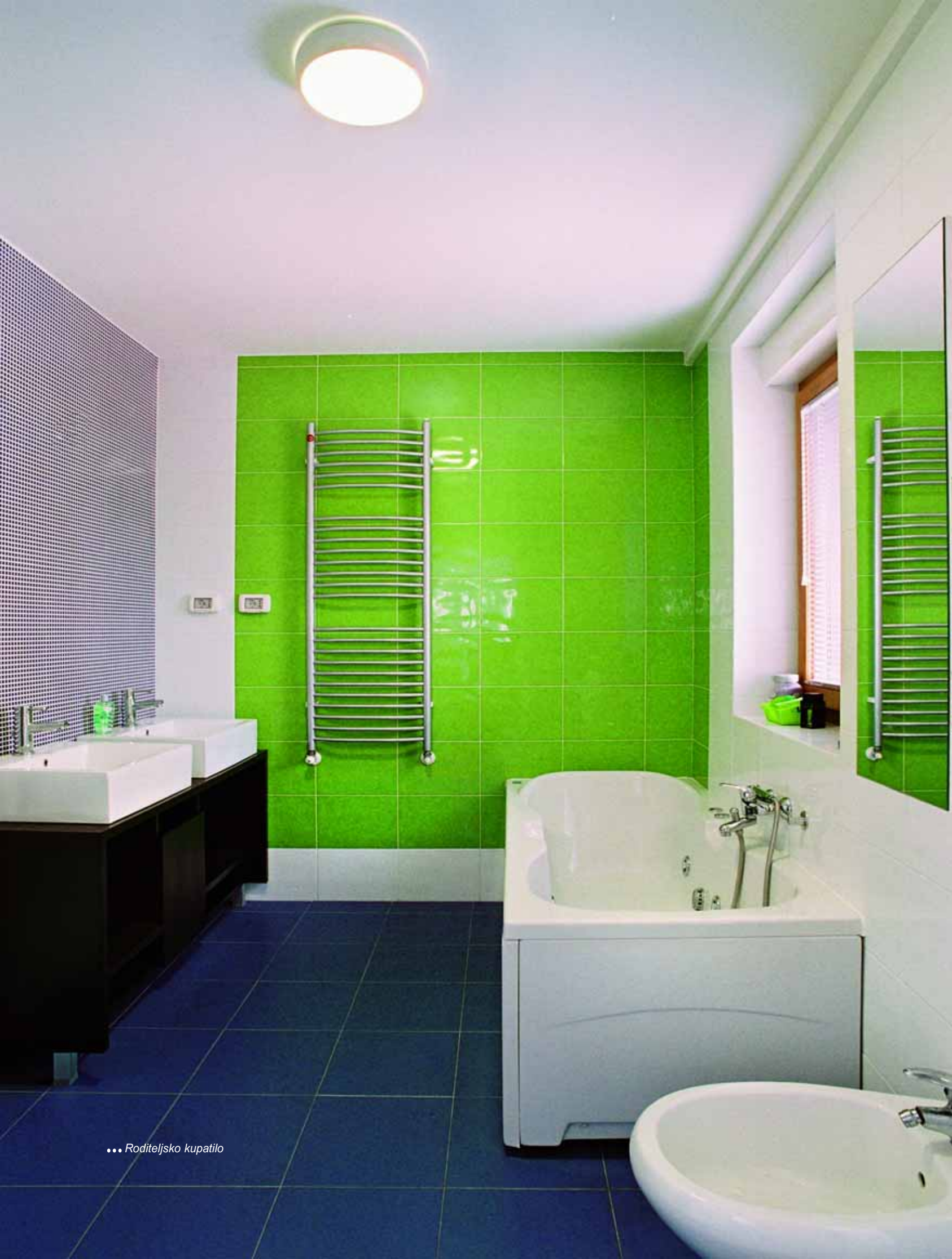
... Roditeljsko kupatilo