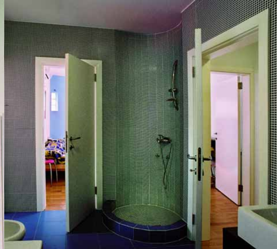
... Zidani ovalni prostor za tuširanje