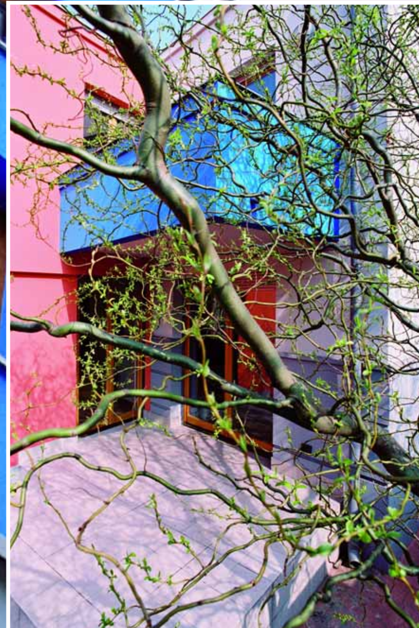
... Fragment fasade i "skulptura" - vrba ukras dvorišta